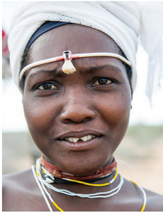
Žena z etnika Mucubal, oblast jižní Angoly – Afrika