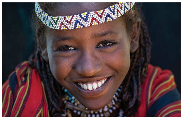
Afarské dívky s charakteristicky zašpičatělými zuby, Danakilská oblast – Etiopie

V Asii jsou dodnes uctívána podobná božstva se špičatými zuby a také u súdánských kmenů, v Indii a v oblasti zahrnující Vietnam, Kambodžu, Laos, Čínu až po Japonsko, nevyjímaje celou Indonésii s Bali. Ve velké části střední Afriky jsou u mnoha kmenů rituály zašpičatění zubů praktikovány dodnes – například kmeny Pygmejů a Afarů z oblasti Danakil v Etiopii. V historii Mayů byly tyto úpravy symbolem odlišení vyšší třídy od zbytku populace. U jiných kmenů to byl jeden z rituálních úkonů při přechodu z puberty do dospělosti pro dospívající členy spole-