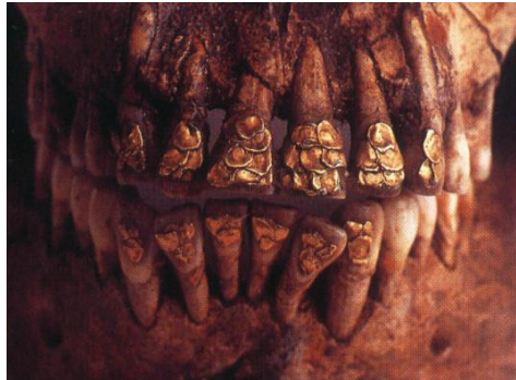
Zuby potažené zlatými plátky, arch. Nálezy – Filipíny