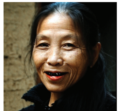
Ukázka praktikování ohaguro – začerňování zubů u žen z etnických skupin v Asii

účelově začerňovány zuby dcerám vojenských velitelů již ve věku 8 až 10 let jako označení jejich dospívání, což bylo přípravou na předem politicky účelově domluvené sňatky. Na konci období Edo se situace pozměnila. Vzhledem k zápachu a pracné aplikaci začerňovací směsi a celkově