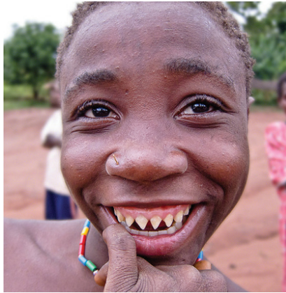
Pygmejský chlapec z oblasti Konga – Afrika