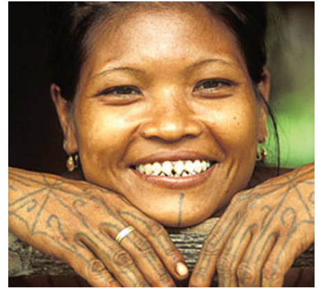
Žena z etnika Mentawai, Sumatra – Indonésie