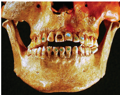
Mayská civilizace – drahé kameny zasazené v zubech