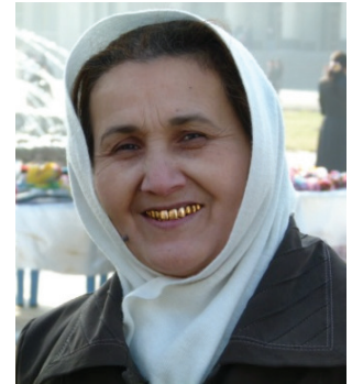
Uzbecká žena se zlatými zuby

čeství. Většinou byli jedinci s podobně upravenými zuby vnímáni také jako více atraktivní.